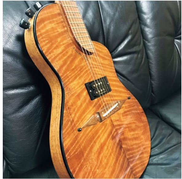
CITESフリー?アメリカ製 表板はレッドウッド (フレーム柄セコイア)、ボディ・ネックはマホガニー (原産国不明!), 指板はイペ

大体こういうこと書くと、「俺んちにいらぬ楽器があるから引き取ってくれ」とか「いくらで売れるか教えろ!」、最悪「買ってくれ」と聞いてくる人が現れる訳ですが、すべてお断りしています。