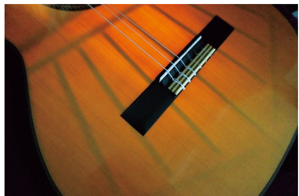
古典的なギターの作りが透けて見える美しい

フォークギターは最近アコースティックギター(アコギ)と呼ばれている。アコースティックギターという、広義ではナイロン弦、鉄弦、フルアコ(和製英語 ホロウボディのf字ホール)までボディで生音が鳴るギターがすべて含まれるが、日本ではフォークギターのことを指す。ではアメリカ人なんかフォークギターのことをなんて呼んでるかという、飲み物のコーラをコーク、ペプシと呼ぶように、マーチンとかギブソンとかメーカー名で呼んでる(非常に狭い知識ですので違うのかも)。