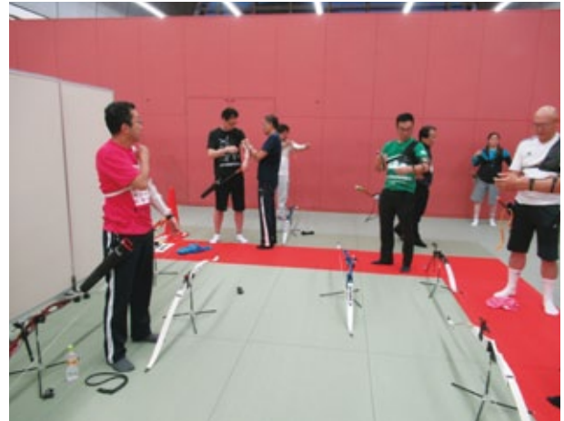
アームガード(腕あて)、チェストガード(胸あて)を装着