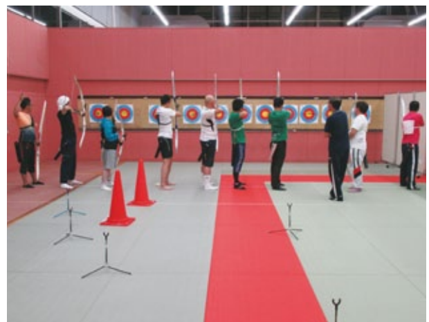
ボウとアローを使い4m先の的を狙う