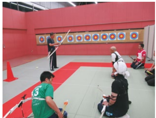
指導員の説明に耳を傾ける新木場の有志