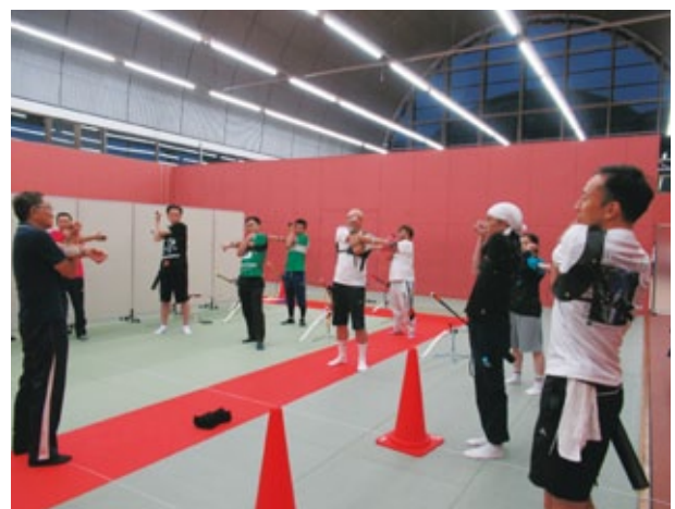
先ずはお決まりの準備体操

さて、いよいよ講習会の開始となります。指導員から防具や用具を手渡され、外のグラウンドの方に行こうとすると皆さんは初心者なので室内で講習を行います、今日は4mの距離からの的を狙いますと言われ一同ガックリする。しかしながら皆、防具と用具を身に着けると選手のような気分になり、テンションが高まり早く矢を射てみたくなる。先ずはお決まりの準備体操から始まる。アーチェリーは飛んだり走ったりしないので、上半身中心で特に腕と首周りを重点的にほぐしてゆく。次に先ほど身に着けた防具と用具の説明を受ける。そして注意事項(マナー)については念入りにお話しされる。一つ間違えれば重大事故につながるので、我々も真剣にマナーについて話を聞いた。ここから実技にうつる。まず、構えから教えてもらう。気をつけの姿勢から足を肩幅くらいに開いていく(スタンス)。次に的に顔を向けていく。野球のバッティングフォームのようだ。まだアローは持たずに、ゴム紐を渡される。