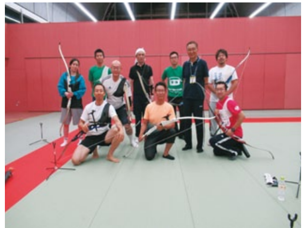
新木場の有志と指導員

け刺さる強者も出てきた。1時間45分間の講習も終わりとなり、全員で後片付けを行う。アーチェリーの用具の価格は、15万円あればお釣りがくるようで、オリンピック選手でもせいぜい25万円くらいの物を使用しているとのことである。某社長のゴルフクラブ一式より格段に安いなあと思った。屋外での練習(30m以上)に参加できるようになるにはどれくらいの日数が必要ですかと尋ねたら、毎週2回練習に来て、素質のある人で5～6か月くらい、普通の人だと8～10か月かなと言われる。はじめて一年半で国体に出場した人もいるようだ。今回参加した10名全員の感想は、楽しかった、また挑戦したい、アーチェリーは見るよりやる方が面白いというものであった。2020年の東京オリンピックまであと3年、日本代表になるにはぎりぎり間に合うかな？