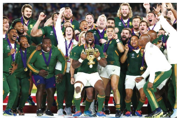
南アフリカ・コリシ主将がウェブ・エリスカップを掲げる瞬間