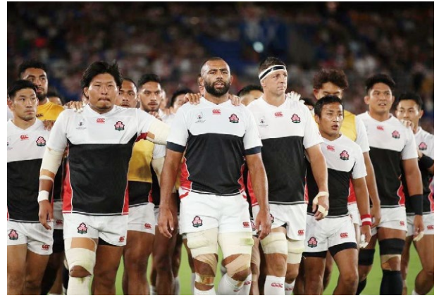
ロッカールームへ『ワンチーム・ワンハート』

キックオフの時間が近づき、選手入場。 試合前の『君が代』・『アイルランズ・コール』の 大合唱。