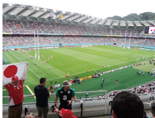
とても綺麗なエコパスタジアム