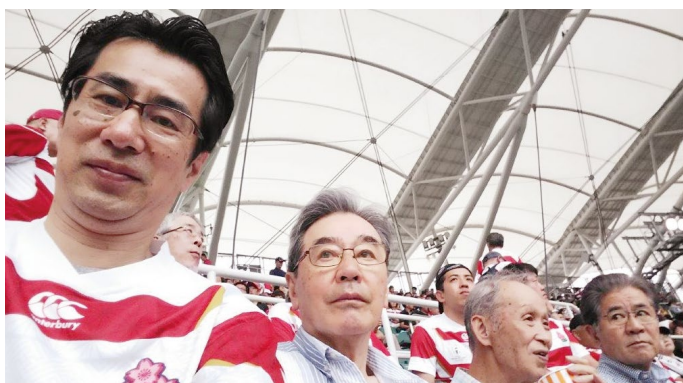
強豪相手に少し緊張気味？

試合前のアップが終わり、いつものスタイルでロッカールームへ向かう。日本代表が『ワンチーム』であることを象徴する姿であります。