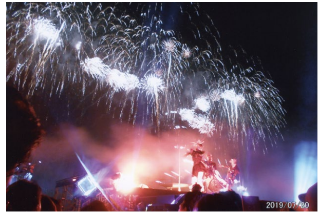
音楽に合わせて光と花火がコラボする

和元年7月20日)は会場をお台場から「豊洲ぐるり公園」に移したことで会場規模は拡張し、来場者の上限を設けつつも規模、キャパシティとも拡大したのである。