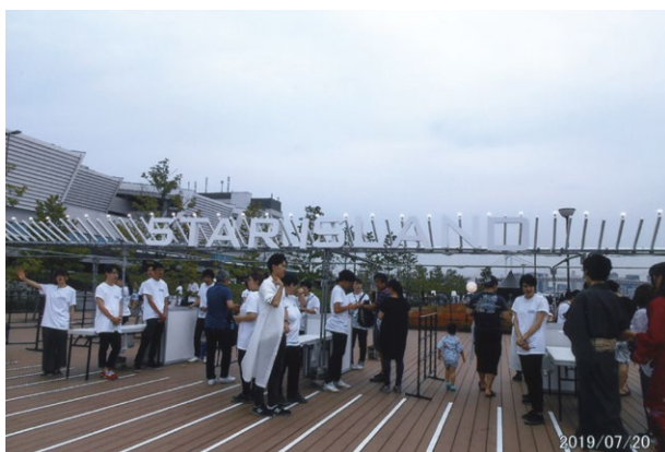
スターアイランド入場ゲートである。まだ早かったなので、入場者は少ないが、ここを1万5,000人が入場した

大規模な花火大会と規模を縮小する花火大会、その二極化が進む中において、この「スターアイランド」の出現は鮮烈なものであったという。未来型花火エンターテイメントを掲げ、花火大会の常識に反して入場は完全有料制を採用、最も安い席種でもチケット代は1人8,000円からであるにもかかわらず、2017～2018年共に1万5,000枚のチケットは完売したという。2018年(平成30)末には早くも海外進出を