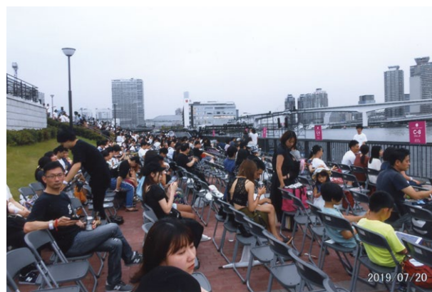
会場のイスが並んでいるところ。まだ早かったのですが、満員となった。この場所の1席、15,000円