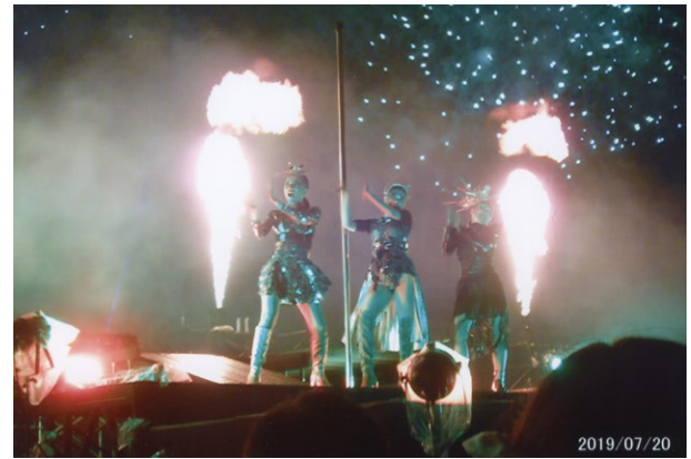
炎が一瞬に噴き出て、パフォーマンスが演じる。どんどん変わっていく

いつも花火大会に参加すると帰りが心配になるが、今回は席により、順次案内され、全く混乱はなかった。しかし帰りは豊洲駅まで誘導され、50分程かかった。