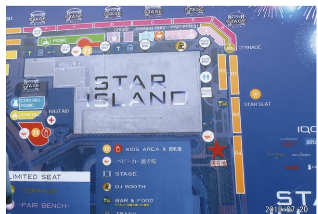
豊洲の「豊洲ぐるり公園」に設備された、スターアイランドの会場レイアウトである。上部にステージが6か所ある。ここは新豊洲市場の奥にある公園です