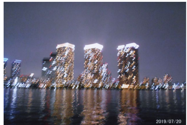
東京湾の会場近くから見た夜景。あのシンガポールのマリーナ・ベイに似たところがあるが、屋上がつながっていない

花火だけではない総合的な演出を体験してもらおうという意図から、来場者の上限を設定し、2019年（令