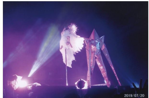
海上から炎や光が交差して出現する

イベントそのものも、花火をメインとして打ち出す構成ではなく、競技花火大会を始め、日本の花火大会は花火そのものの美しさや芸術性を売りにしたものが主流であるが、「スターアイランド」は、花火だけではなく、水域でのパフォーマンスやポールダンサーやストリート、ヒップホップにコンテンポラリーといった様々なジャンルのダンサー、さらにロンドンオリンピックにフェアリージャパンとして出場した新体操選手を含めた新体操チームや、BMX、スティルトのパフォーマンスが新たに追加、多岐に渡るパフォーマーが出演した。いずれも、単体のショーの主役として成立するコンテンツばかりを集めたのである。