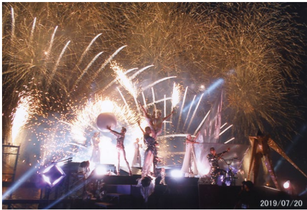
7時30分にオープン。花火と光とサウンド、舞台にめまぐるしく、シーンは変わっていく