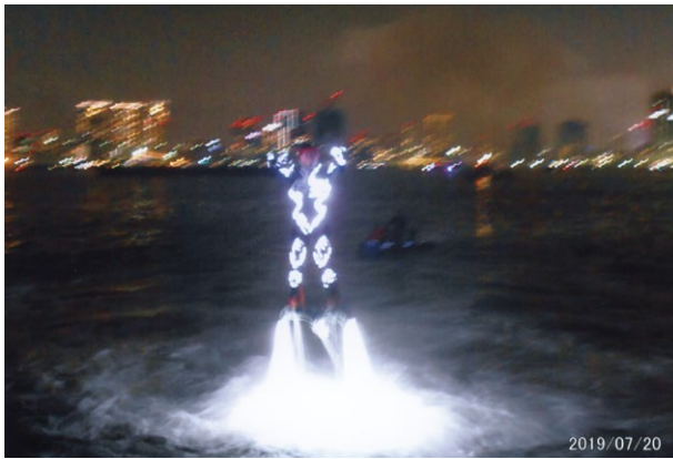
摩天楼をバックに水圧で空を飛ぶ、パフォーマンス