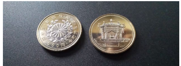
左側 裏 右側 表