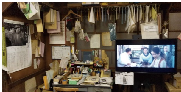
下の写真は、上の写真を左側及び右側をズームアップした写真