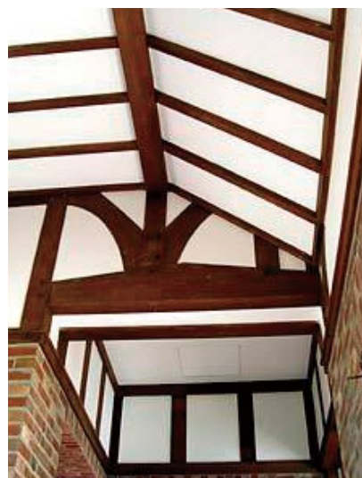
ハーフティンバー方式の変形