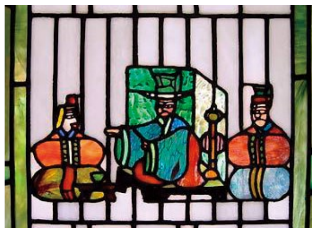
大広間のステンドグラス貴人供応の図