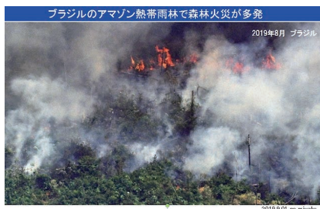
ブラジルアマゾンの森林火災

南半球で冬季のブラジル中部でも、過去50日にわたり十分な雨が降らず、世界最大級のパンタナール湿原地帯等で火災が発生、ブラジル国立宇宙研究所は今年に入り5万件以上の森林火災を観測している。