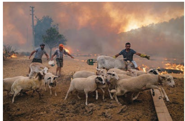
スペインカナリア諸島の山火事、牧場まで迫る。