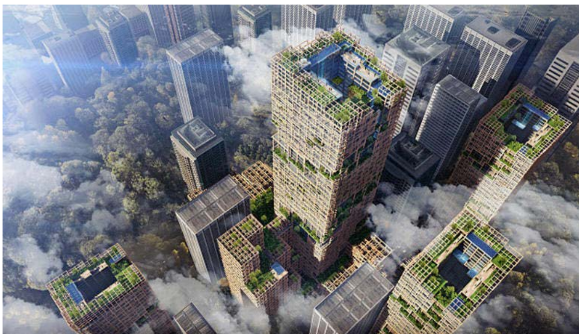
住友林業の街を木の森にかえる開発構想 W350計画 未来イメージ図

東京海上日動火災保険は、地下3階・地上19階建(延床面積約12.5万㎡)の「新・本店ビル計画」(28年度竣工予定)している、柱や床材などの構造材に木材を用いて、「国産材1万㎡の利用を見込んでいる」