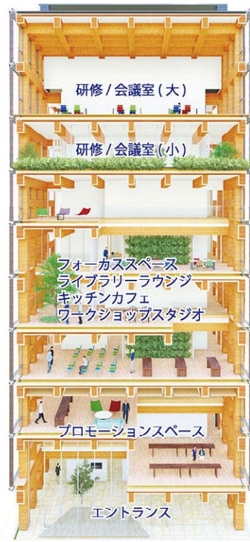
大林組高層純木造耐火建築物のビルと内部の構造