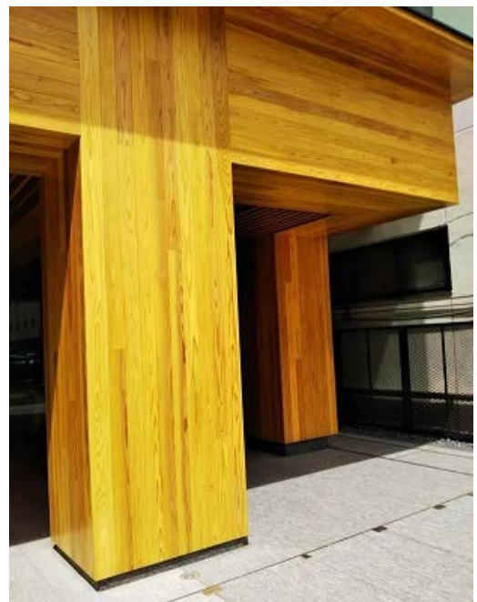
時間耐火仕様耐火木造技術柱「オメガウッド」

また、建物の外皮負荷を最小化し、自然エネルギーを積極的に活用したうえ、建物の利用計画・方法を勘案した最適な環境技術を多数導入することで、一般的な建物と比較してエネルギー消費量が50%以下となるZEB Ready (ネット・ゼロ・エネルギー・ビル・レディ)を実現し、さらには大林組技術研究所(東京都清瀬市)本館テクノステーションでの実績を踏まえて、ウェルネスに配慮した建物・室内環境評価基準であるWELL認証、およびLEED認証の取得を目指す。