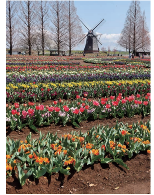
お花のコントラストが最高！