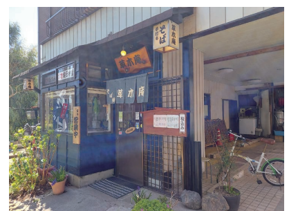
本土寺参道の蕎麦屋「草木庵」