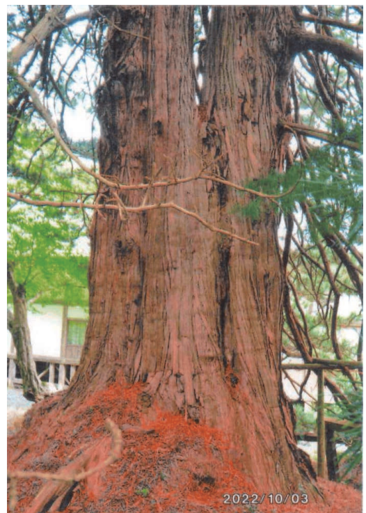
写真番号 3 祇劫寺の Kouyama