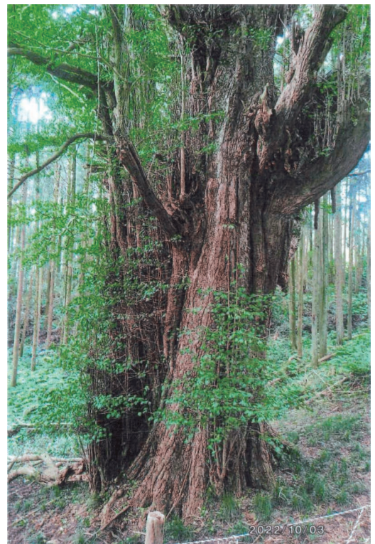
写真番号1 久保の大カツラ

また嬉しいことに根元に「ヒコバエ」が緑の若葉を散らし、力士の化粧まわしを想わすような雰囲気醸し出し、このカツラの古樹を際立たせている。そして全体が何とも言えぬ気品を感じたのは筆者がこのカツラに入れ込みすぎているからだろうか。