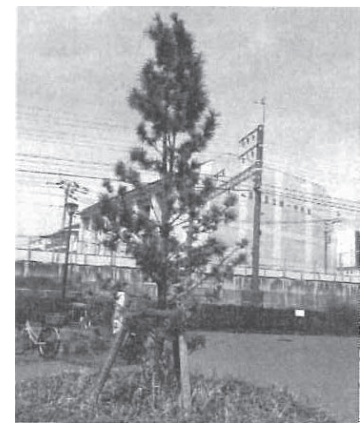
写真番号5 コウヤマキの銘板と千住大橋ゆかりの木