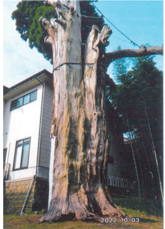
写真番号 2 薬師堂の姥スギ