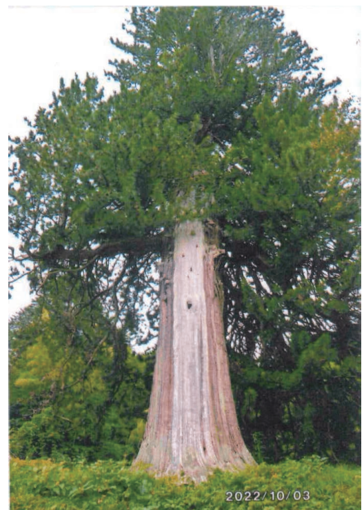
写真番号4 石雲寺のコウヤマキ

大橋はその後流失のたびにかけ替えられ、江戸時代を通じて維持された。コウヤマキは主として橋杭材に使用された。千住大橋は当時多くの文人、粹人、浮世絵師、画師たちが