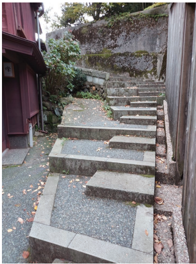
金沢市内 暗がり坂