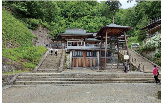
如法堂 別名奥の院