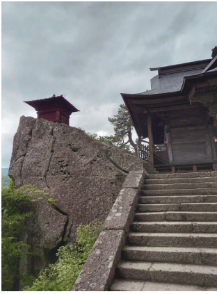
朱に塗られた納経堂と開山堂