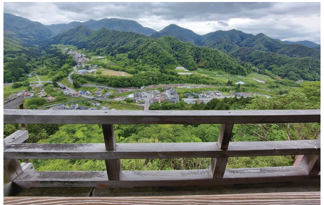
五大堂からの眺望