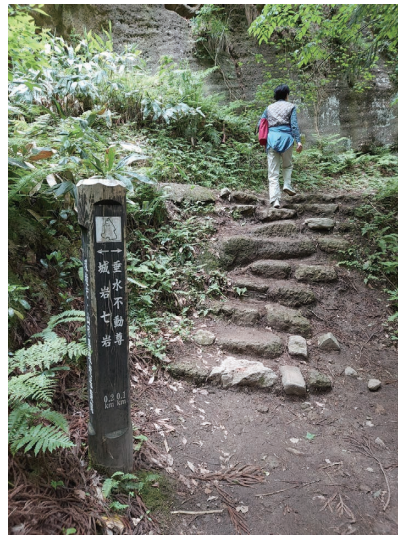
垂水遺跡までの道のり