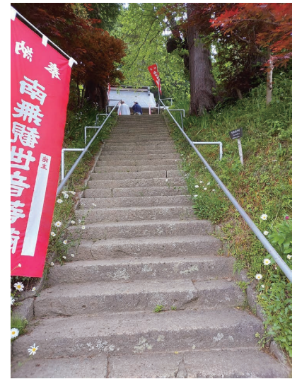
垂水遺跡入り口・千手院観音までの階段

性相院で御朱印を頂こうとしたが小銭を使い果たす。千円札でおつり銭をお願いしたところ「お布施には本来釣りは出せない」と説教をされてしまう。もっともなご意見、痛み入ります。皆さん、小銭はたくさん用意してから出かけましょう！