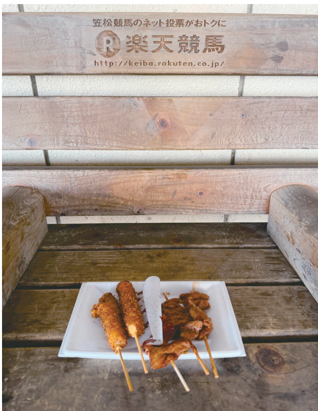
競馬場グルメ 串カツ・どて煮