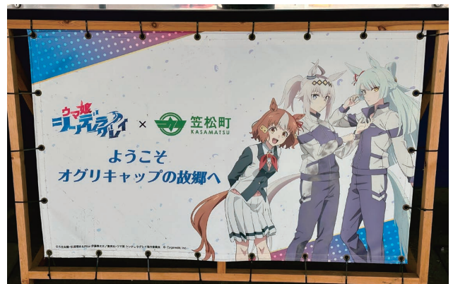
人気の『ウマ娘』とのコラボ企画

実在する競走馬を育成するクロスメディアコンテンツ「ウマ娘」とのコラボレーションもあり多くの人 が訪れていた。何とも言えない趣のある競馬場グルメを心地よい蹄の音を聞きながら堪能した。馬券を 買わなくても充分楽しめる、休日に友達や家族と訪れたい場所だなあと思った。町を歩くと役場ではス タンプラリーを実施していたり、お店で指定された物を買えばグッズが貰えたりと、競馬で町おこし。 ウマ娘ファンなのか、外国人も多く、こぞってイベントに参加していた。地方から中央の頂点に立った オグリキャップ、またこの町からスターホースが生まれ、更に活気に満ちた町になって欲しいと切に願う。