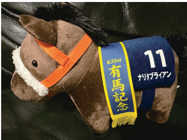
シャドーロールの怪物 ナリタブライアン